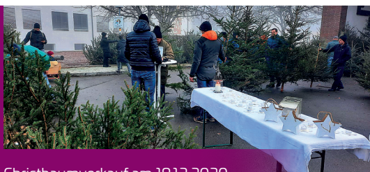
Christbaumverkauf am 19.12.2020

Ein großes Dankeschön gilt allen KlauslerInnen, die den Christbaumverkauf der Agrargemeinschaft am 19. Dezember 2020 genutzt haben. Wir freuen uns sehr, dass das Angebot dieses Mal besonders großen Anklang gefunden hat.