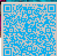
QR-Code Umfrage Spielplatz