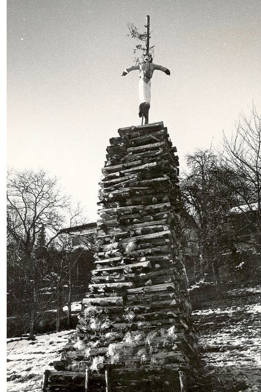
Klauser Funken Ender der 80er Jahre, oberhalb der Anna-Hensler-Straße